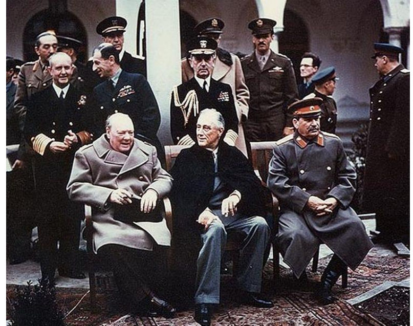
Conferência de Yalta (Crimeia, URSS) em fevereiro de 1945. Da direita para a esquerda (Stálin, Roosevelt e Churchill)

Embora URSS e EUA tenham lutado no mesmo bloco na Segunda Guerra suas diferenças ficaram evidentes, especialmente nos acordos do final do conflito como o de Yalta (fevereiro/1945) e Potsdam (junho/1945) que definiram os rumos do mundo pós guerra.