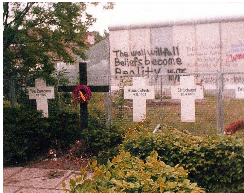
Memorial em homenagem as vítimas do Muro de Berlim. Disponível em < encurtador.com.br/ejHIO > Acesso 06.04.2021

Em novembro de 2019 completaram-se 30 anos da queda do Muro de Berlim . Atualmente, seus restos são visitados por milhares de turistas. Se constitui como um importante lugar de memória . Representa uma experiência dolorosa, mas que não deve ser esquecida.